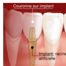
Couronne sur implant dentaire

Le choix d'une prothèse dentaire s'effectue en concertation avec votre chirurgien-dentiste