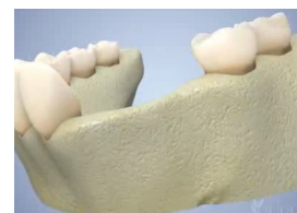
Volume osseux faible

La greffe peut être réalisée au cabinet ou en clinique, sous anesthésie locale ou générale