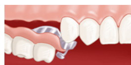
Insertion de la prothèse à châssis métallique