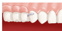
Prothèse en place